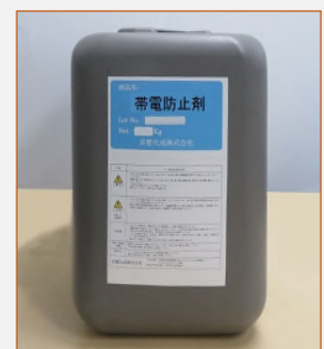
販売容器 (10 kg 容器)