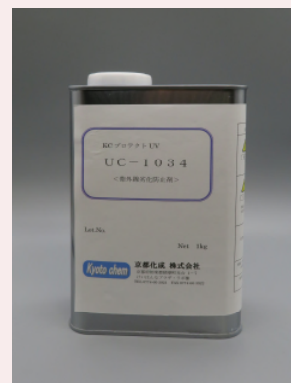
販売容器 (1 kg 缶)